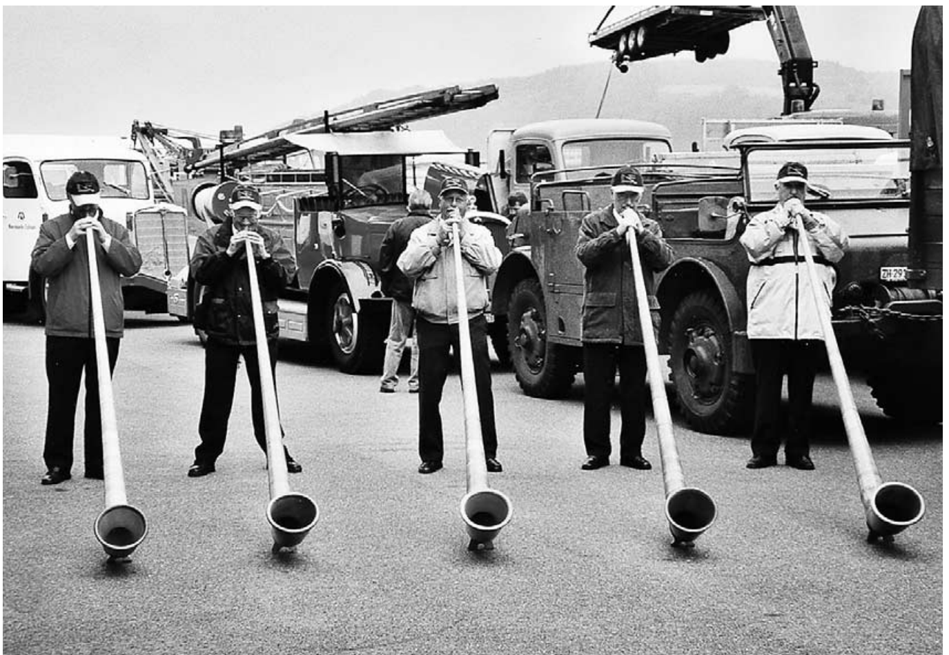
Musikalische Darbietung: Wegmüller-Ausfahrt