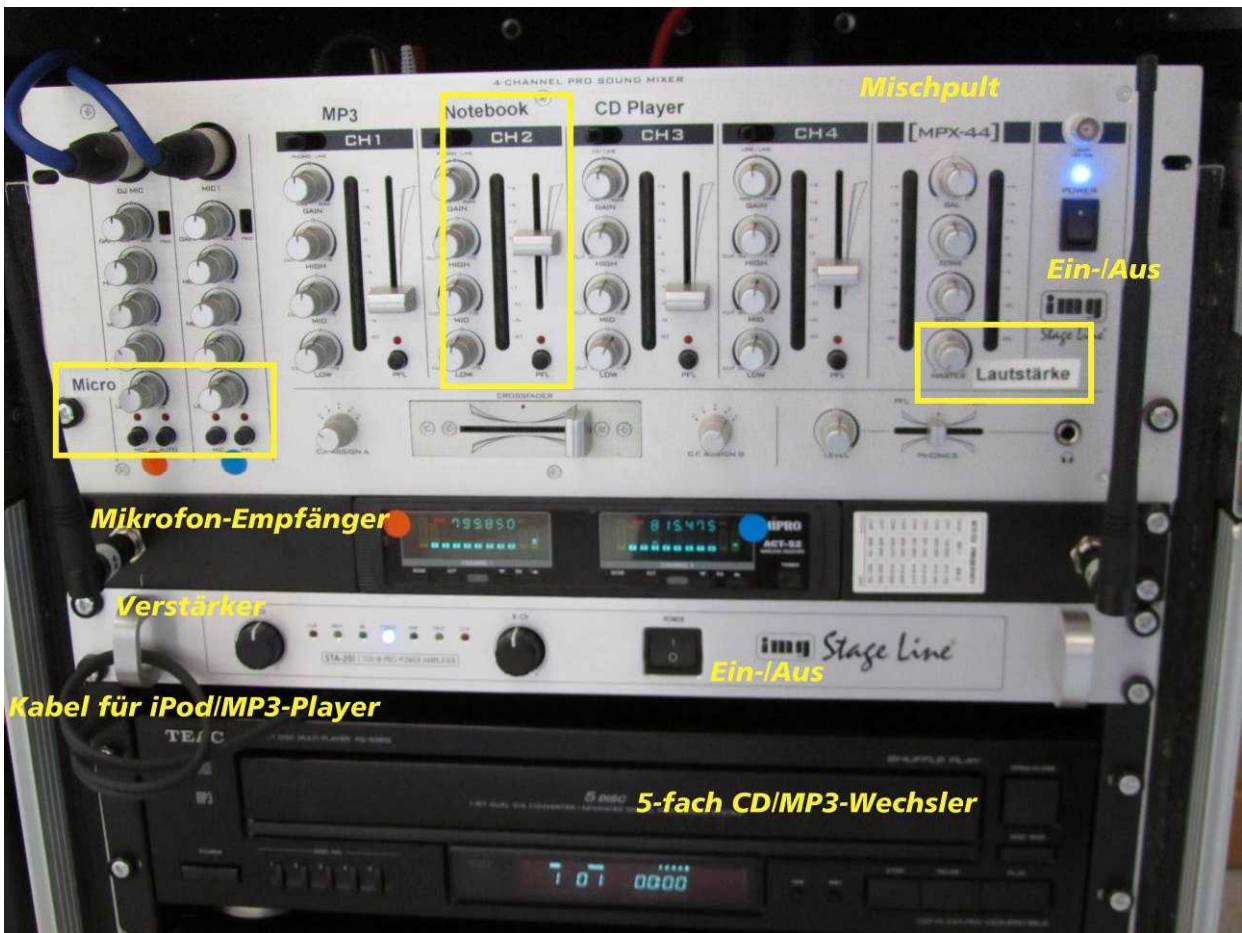
Bild 9: Anlage im Rack: Zuerst Mischpult, dann Mikrofon-Empfänger, Verstärker, CD-Wechsler