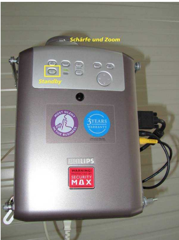
Bild 1: Beamer (einschalten: 1-mal auf Knopf Standby drücken, ausschalten: 2-mal kurz nacheinander auf Standby drücken)