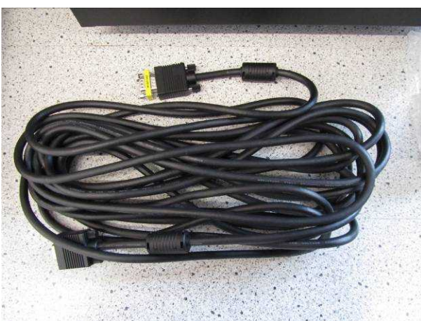
Bild 5: VGA Verlängerungskabel 10m (hier mit montiertem Gender-Changer)